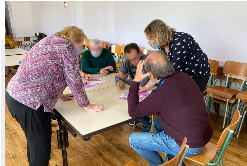
Exemple de groupe de travail animé par ENERTRAG

Les permanences d'information des 19 et 20 novembre seront l'occasion de vous informer sur l'énergie éolienne et sur le projet de Moulin Bois.